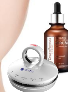
Ампула и КРУГЛЯШКА