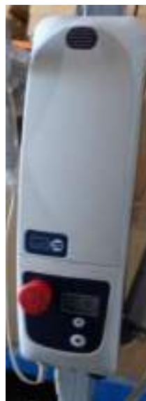
Рис. 8 Лицевая панель блока управления .

Кнопка включения механизма экстренного опускания.